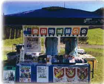
(左写真) 動物愛護活動イベントで自活動のPRもします。