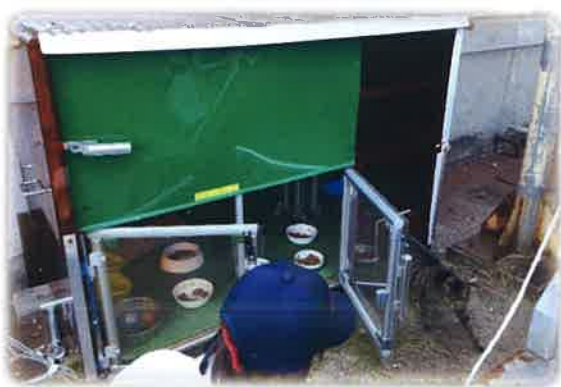
トヨタ自動車(株)工場内に設置されている「猫ハウス」です。ここには13匹の地域猫が餌を食べ寝泊まりしています。

地域猫活動の普及と定着支援をしています。具体的には各種イベントでの地域猫活動のPRや地域猫の不妊手術と給餌（きゅうじ）やトイレの管理に取り組む住民ボランティアに対するアドバイスなどを行っています。