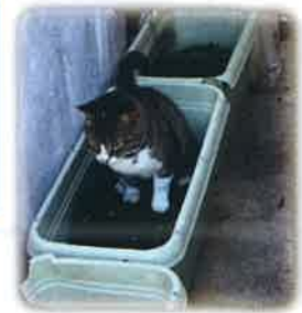
(上写真) 屋外に設置したトイレで用を足す姿。

飼い主のいない猫を放置せず地域で意見交換をして出来るだけ多くの合意を得ながら見守り管理する活動です。